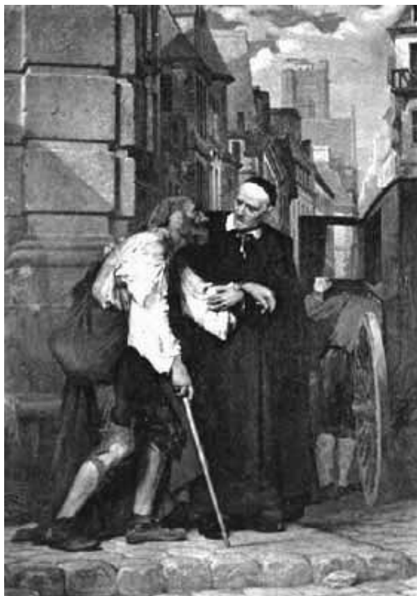
Pastor Vincentius menganjurkan agar secara teratur dan kerap mengunjungi orang-orang yang miskin.