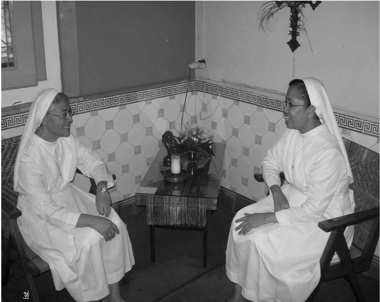
Dalam praktek bimbingan rohani sikap empati penting dan membantu mengurai benang kusut.

Otoritas diadakan bukan untuk memberikan perintah-perintah. Ketaatan telah direndahkan maknanya atas nama Hidup Bakti. Hal ini masih terjadi sampai sekarang. Memang lebih mudah menurut daripada berinisiatif sendiri, lebih mudah untuk tunduk pada perintah orang lain daripada berpikir sendiri, lebih mudah mengikuti sistem yang sudah ada daripada mempertahankannya.